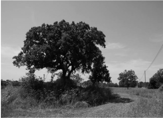
Fig. 2 - Esempio di habitat a Crambe hispanica (Martina Franca).