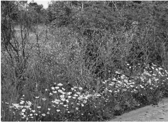
Fig. 3 - Vegetazione a Crambe hispanica (Gargano).

proprio nell'area del fragno. Questa brassicacea, come già osservato per il Gargano, richiede un certo tasso di umidità climatica, e tra i boschi di Quercus pubescens s.l. e quelli di Q. trojana Webb, sono questi ultimi a presentare condizioni più favorevoli ad ospitare le cenosi a C. hispanica . Non è raro, infatti, rinvenire esemplari di fragno in aree depresse, ma non soggette a lunghi periodi di allagamento (De Pinto & Macchia, 1987) in accordo con il fatto che si tratta di una specie quercina che richiede un elevato tasso di umidità, anche se rifugge da terreni con acqua stagnante (Bianco, 1961; Francini-Corti, 1966) e predilige un clima sufficientemente mite (Crivellari, 1950). Ciò trova conferma dal regime pluviometrico di Locorotondo che, dopo Martina Franca, è il comune che presenta la più elevata frequenza di precipitazioni di tutto il comprensorio mugliano sud-orientale e ben si lega con l'ecologia del fragno, specie quercina che ha bisogno di sovvenzionamento idrico dall'emissione fino al differenziamento completo delle foglie (De